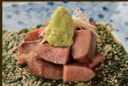
山葵たん 3,480円 3,828円(税込)