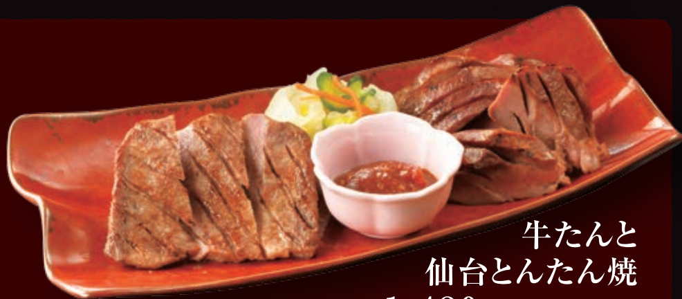
牛たん 仙台とんたん焼 1,480円 1,628円(税込)