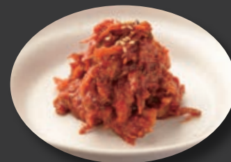
牛たんキムチ 380円 418円(税込)