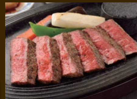
仙台牛 赤身ステーキ 3,480円 3,828円(税込)