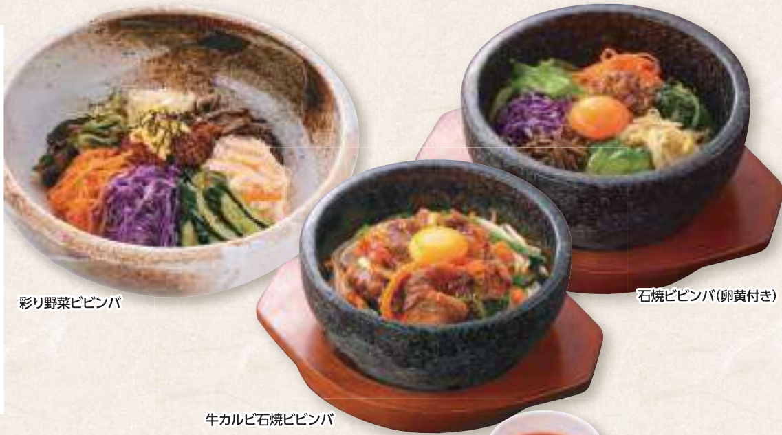
彩り野菜ビビンバ