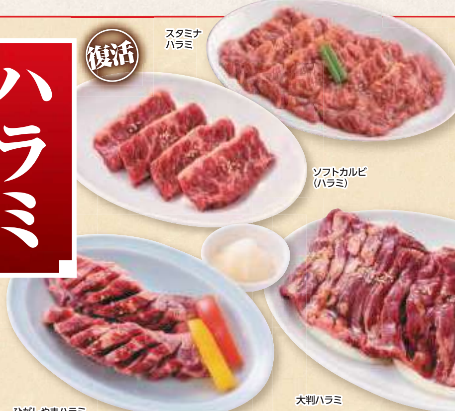
ひがしやまハラミ