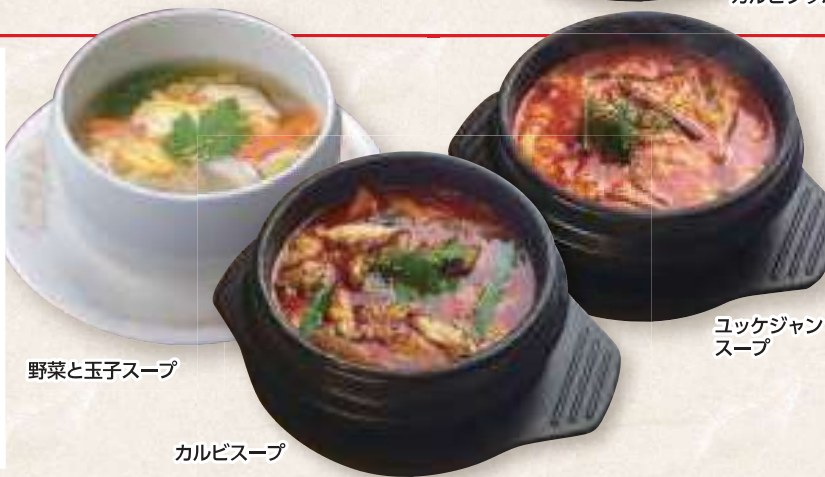
野菜と玉子スープ